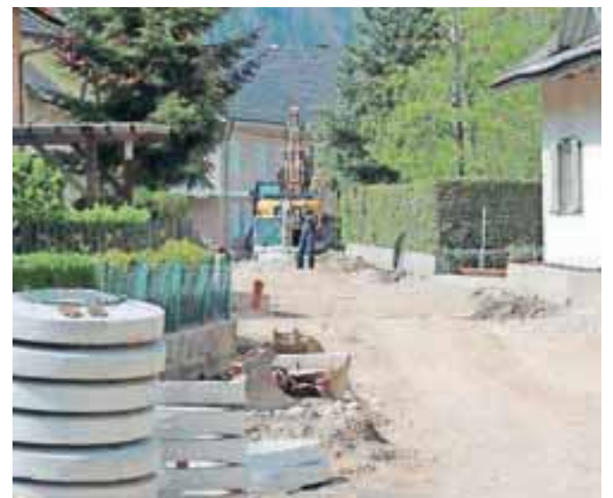
Dnevno se možnost dostopa do posameznih objektov spreminja, saj je celotno območje Podmežakle gradbišče in izvajalec izvaja dela z več skupinami. Občani najbolj točne informacije glede vsakodnevnega zaprtja cest lahko dobijo pri izvajalcih na terenu.