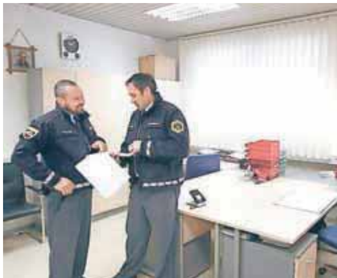
Policisti so na Karavankah dobili bistveno boljše pogoje za delo.

prostorov za pridržanje, saj so standardi za njihovo ureditev zelo visoki. Tako storilce še vedno vozijo v pridržanje v Kranj, Tržič in Škofjo Loko, po analizi Policijske uprave Kranj pa ti trije objekti zadoščajo. Policijska pisarna na železniški postaji pa je urejena v prostorih Slovenskih železnic, prostori so povsem prenovljeni, stroški najemnine pa so minimalni, je še povedal komandir.