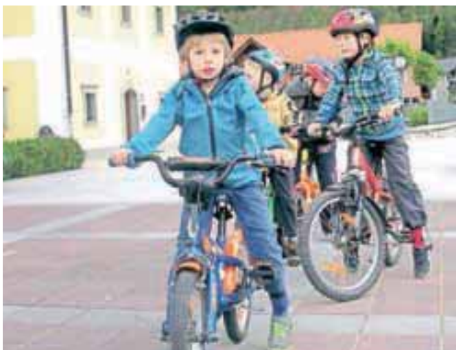
Na tečaju sodeluje dvanaest otrok.