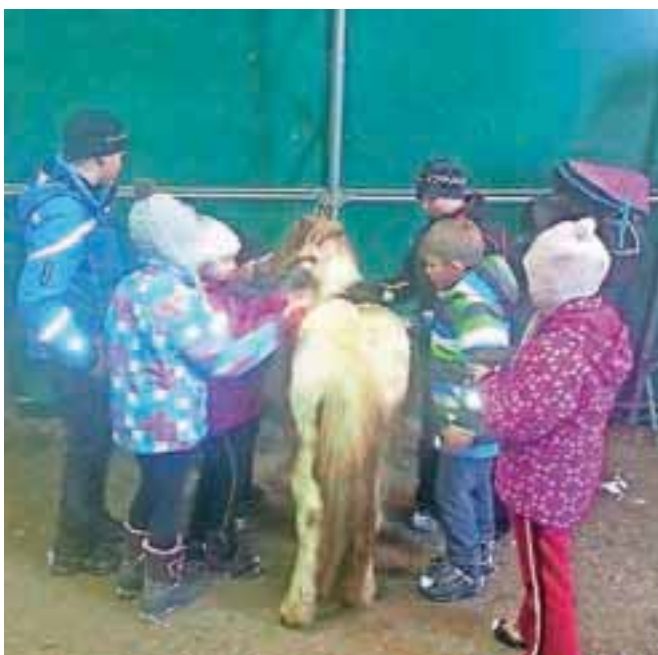
Otroci uživajo med domačimi živalmi, zlasti konji, in na svežem zraku. / FOTO: ARHIV KMETIJE SMOLEJ-URIC