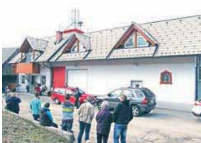
Nov večnamenski prostor v gasilskem domu je namenjen kraju in krajanom.