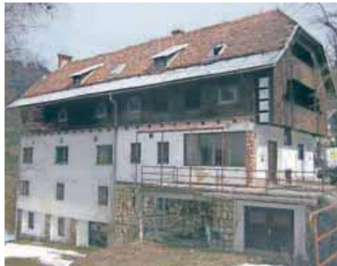
Zapuščeni Dom pod Golico sredi vasi danes

Druga svetovna vojna in prva povojna leta niso prizanesla niti Boštjanu Belcijanu niti hotelu. Mojster je bil kljub sodelovanju s partizani po vojni obsojen na zaplembo premoženja, ker je med vojno nadaljeval gradbeno dejavnost. Odvzem premoženja ga je zelo potrl. Od takrat se je preživljal kot nadzornik pri različnih gradnjah in z risanjem načrtov, posvetil pa se je tudi čebelarstvu. Strt in zagrenjen je umrl 24. avgusta 1970 na svojem domu v Gori pri Komendi.